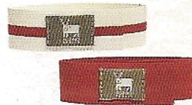
Hosenbänder aus Plane von Albino Berlin, 10 Euro