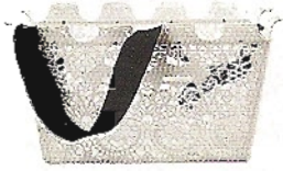
Kaffeezeit: Korb von Design House Stockholm, 86,50 Euro