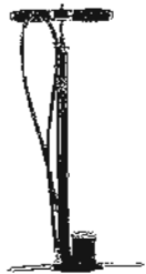
Platt? Luftpumpe »SKS Rennkompressor« über bike24.net , 49,90 Euro