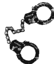
Handschellenschloss über bike24.net , 55,90 Euro