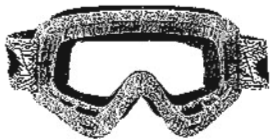
Matschwetter? Goggles »Crowbar MX« von Oakley, 69 Euro