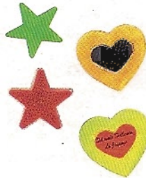
Unübersehbar: Reflektoren über okversand.com , je 2,50 Euro