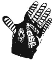
Alles im Griff: Handschuh von Roeckl, 39,50 Euro