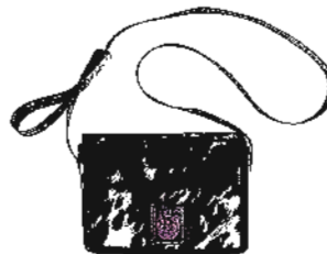
Aus Kuhfell: Tasche von Killer Taschen über dawanda.com , 105 Euro