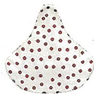
Sattelschoner von FREAKZberlin über dawanda.com , 10 Euro