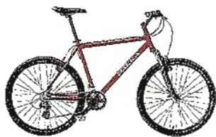
Das Wichtigste: Mountainbike von Pakka, 399 Euro