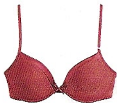
Brauchtum: Roter BH mit Goldglitzer von Triumph, 39,95 Euro