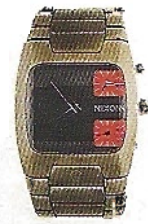
Zeitanzeiger: Herrenuhr von Nixon über Rocket, 238 Euro