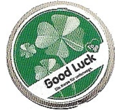
Glück in der Dose: Kerze von Donkey Products, 7,20 Euro