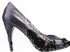
Hoch hinaus: violette Peeptoes über duoboots.com , 125 Euro