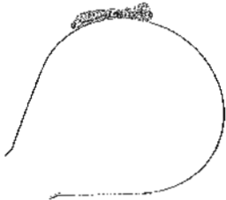
Bereift: Haarschmuck mit Schleife von Accessorize, 8,90 Euro