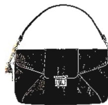
In festen Händen: Handtasche von Kipling, 79,90 Euro