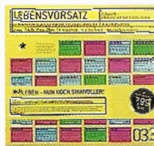
Alle Jahre wieder: Lebensvorsätze über contor-design.com , 7,99 Euro