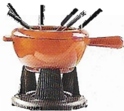
Dinner for one: Käsefondueset von Le Creuset, 189 Euro