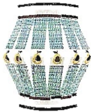
Erleuchtet: Minilaternen über geschenkefeuerfreunde.de , 9,90 Euro