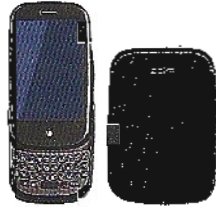
Für Neujahrsgrüße: Pre von Palm, 481 Euro